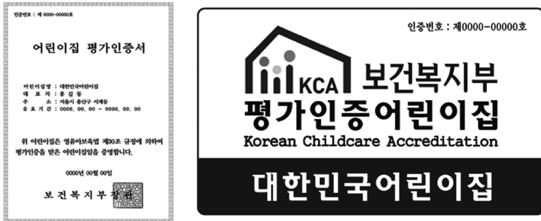
写真1 保健福祉部長官の名義の認証書と認証看板