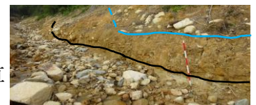
図5 過去の土石流がわかる壁

図5の壁（図3のa地点）の青線より上の層は明らかに土石流1回分の堆積の様子を表している。また、図5の写真の左側半分には明瞭に青線より下で黒線より上に土石流1回分の層が見られる。赤白の棒付近の青線の下や黒線の下は粘土層で大きな礫を含む土石流とは異なる比較的穏やかな水流の堆積物である。そのような地層を一部削りながら急に直径数10cmの大きな石と砂泥が混在する淘汰が悪い層があり、これらは通常の水流による粒の大きさがそろった堆積物ではなく、明らかに急激な水の増加で細粒の砂泥と大きな礫と一緒に流れる土石流