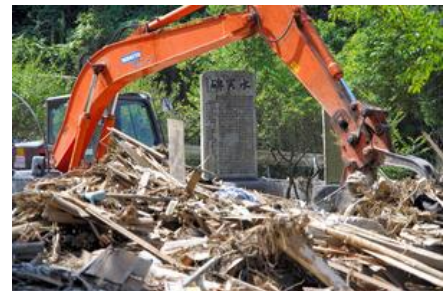
図1 生かされなかった石碑 7)

毎年のように多くの人命を奪ってきた土石流被害を繰り返さないようにするため、筆者らは2014年広島土砂災害と2018年西日本豪雨の被災地やその周辺を回って住民に地域の土石流の危険性と安全確保の説明を行うとともに防災教育の一助とすべく論文を公表してきた 1~6) 。1907年に土石流で44人が死亡した広島県坂町ではその水害を伝える石碑(図1)が生かされず、2018年の西日本豪雨で砂防ダムが崩壊し、16人が