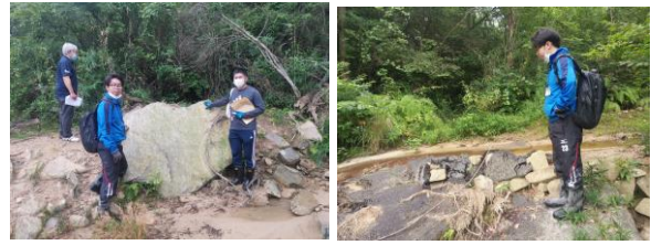
図 14 怖さを伝える写真 図 15 破壊に驚く様子

14 のように自分たちを入れて写真を撮りながら、小さな土石流でも直径 2m 近い大きさの石が流されてくることや、図 15 のようにアスファルト舗装が剥がされたり、破壊されたりすることに驚いたことを児童にぜひ実際に見学させて土石流のパワーを実感させたいと発言された。しかし、