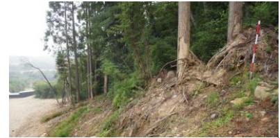
図8 皮がはがれ、枝が掛かる

上側の5つの治山ダムはすべて両翼が破壊され、現在もダムの底が全て埋まっている。しかし、それでもないよりは傾斜を緩くする効果があるため、そのまま残されている(図6:図3のb地点)。側面の表面が削られた跡や木が倒れた位置、木の皮が削られた跡、