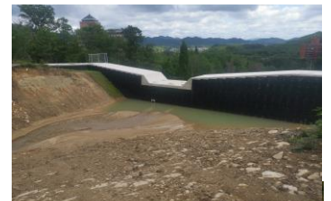
図4 新設の大型の治山ダム

図3①の土石流地域を観察するコースでは、下側の厚さ約2mの2つの治山ダムは、完全に破壊され、新たに厚さ約4mの大きな治山ダムが造られた（図4）。丈夫になったため直径2m以下の岩なら破壊されにくいと考えられる。少しずつ砂泥がたまっているが、まだ満杯になるまでは時間がかかる。ただし、満杯になると土石流を全く食い止められなくなるのでそうなる前にたまった土砂を取り除く必要がある。2018年に大規模土石流が発生し、逆に現在はこれより上流側に直径2mくらいの大きな礫も少しあるが、2018年の土石流でほとんど土砂がなくなってほとんどたまっていないため、しばらくは土石流が発生しそうにない。たまっている量を定期的に監視することで土石流の危険性を予測可能である。