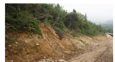
図7 壁の削剥と倒木