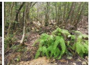
図11 山腹全体に中礫