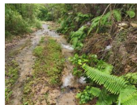
図12 道に地下水湧出