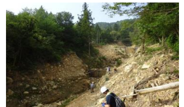
図6 ダムの破碎と両壁の侵食

図5の壁（図3のa地点）の青線より上の層は明らかに土石流1回分の堆積の様子を表している。また、図5の写真の左側半分には明瞭に青線より下で黒線より上に土石流1回分の層が見られる。赤白の棒付近の青線の下や黒線の下は粘土層で大きな礫を含む土石流とは異なる比較的穏やかな水流の堆積物である。そのような地層を一部削りながら急に直径数10cmの大きな石と砂泥が混在する淘汰が悪い層があり、これらは通常の水流による粒の大きさがそろった堆積物ではなく、明らかに急激な水の増加で細粒の砂泥と大きな礫と一緒に流れる土石流