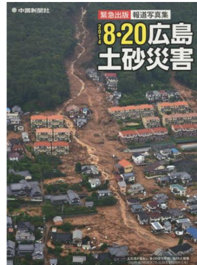
図2 谷沿いが破壊 18)

図2にも見られるように同じ被災地域でも谷沿いの住宅は土石流の直撃を受けて破壊されたものの、尾根沿いの住宅は破壊を免れた。将来自宅を建てる時に不動産業者の説明だけでなく、上流側を見て過去の土石流の跡を判別できれば、大きな犠牲を防ぐことが可能である。また、科学的な知識や判断力がないと、他者に言われても正常性バイアスの影響で避難しないことや旅先では危険箇所情報の正確な把握や近所の人々の声掛けが期待できず、避難しにくいことが問題である。そこで、科学的に状況判断できるようにすることでいつでもどこでも危険性を察知して行動できることが必要と考えられる。