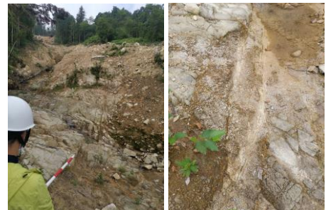
図9 北東南西系(左)と東西系断層(右)

さらに上側には北東-南西系や東-西系の断層、節理が多数あり、周囲の花崗岩の風化がかなり進んでいた(図9:図3cの地点)。この無数の断層により地下水が花崗岩内に入り込み、地下水の凍結による隙間の拡大という物理的な作用や花崗岩の中でも風化がすすみやすい長石が粘土化する化学的作用が促進され、風化が急速に進んだものと推測される。図8のように断層付近の花崗岩の風化が大変激しく、完全な真砂や土に風化が進んでいる事から様々な方向の断層が繰り返し発生したことでもろくなった風化花崗岩がさらに結晶同志の境界の細部にまで水が浸透したものと考えられる。この上部の無数の断層による花崗岩の著しい風化がハザードマップにも危険地域に指定されていなかったゆるい傾斜地で大規模な土石流が発生した大きな原因の1つと考えられ、土石流のもとがたまっていないか確認する必要がある。