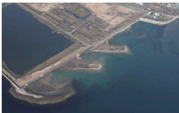
図2 五日市人工干潟概況（平成22年造成当時）

授業概要を表4に示す。授業では五日市人工干潟（図2）を環境再生・修復事業の事例として取り上げ、八幡川河口干潟の埋立という社会基盤整備事業における海域環境の改変から修復、その効果について具体的な情報を提示した。その際、初期の人工干潟造成における技術的な失敗や、その失敗をもとに人工干潟造成に関する新たな造成手法や管理手法が構築された経緯などを示した。