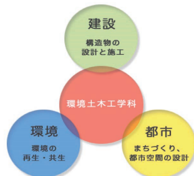
図1 環境土木工学科における学びのポイントと分野