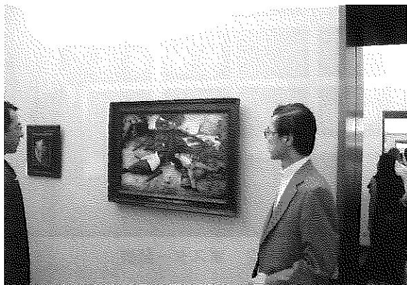
写真3 ブリューゲル作品(アルテ・ピナコテークにて)

今回の学会主催者はミュージアム・ナイトと称して、上記2美術館のほかピナコテーク・デア・モデルネを9月4日(月)の夜間(19:30~23:00)に特別開館し、学会参加者だけが無料で入場できるという粋な計らいをしてくれていた。ちなみに、アルテ・ピナコテークは14~18世紀の欧州絵画を収集する世界的な美術館であり、ノイエ・ピナコテークには印象派など欧州近代絵画を中心に展示してある。お陰で好きな絵の前ではゆっくり時間をかけて、いろいろな名画を鑑賞することができた。写真3はブリューゲル作「怠け者の天国」の横に立ち、「帰国後は今日のように昼間からビールというわけにはいかないな」