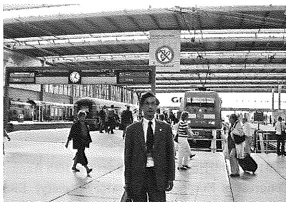
写真4 ミュンヘン中央駅の禁煙マーク

と自戒しつつ眺めているところである。ピナコテーク・デア・モデルネは館内には入らなかったが、芸術、建築、デザイン、グラフィックの4部門からなるヨーロッパ最大の現代美術館ということである。