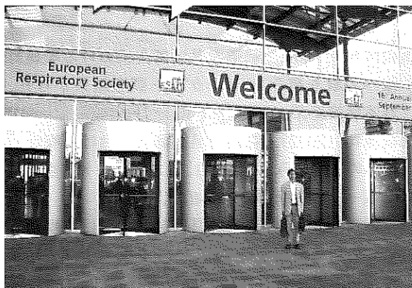
写真1 学会場入り口にて

日本の喫煙対策が遅れているのは、社会的・政治的問題もあるわけであるが、まずヘルスプロフェッショナルとして国民の健康を守るべき医師の活動が大切であり、その職能団体である医師会の役割も非常に重要である。喫煙対策に取り組んでいる都道府県医師会は、1997年にはまだ少なかったが、今回のアンケート調査では2001年に比べても著明に増加しており、ほとんどの医師会が喫煙対策に取り組んで