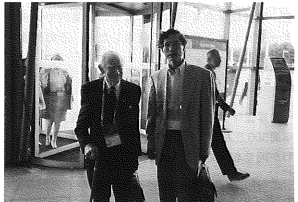
写真3 ジョン・クロフトン卿（エジンバラ大学名誉教授）と筆者